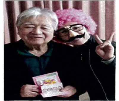
さて!! 誰が変装しているのしょうか!?