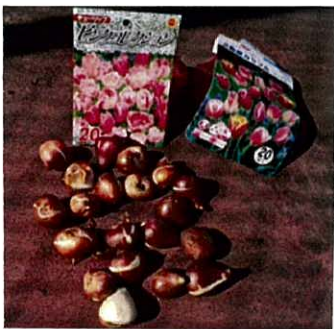
春には、かわいいチューリップが♡♡♡